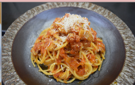
清川恵水ポークの自家製パンチエッタと玉ねぎの「トマトソースのスパゲッティ」