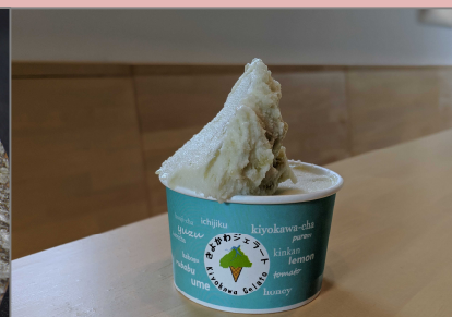
ルバーブ、はちみつミルク、お茶など、清川村の食材を活かしたフレーバーから選べる「ジェラート」